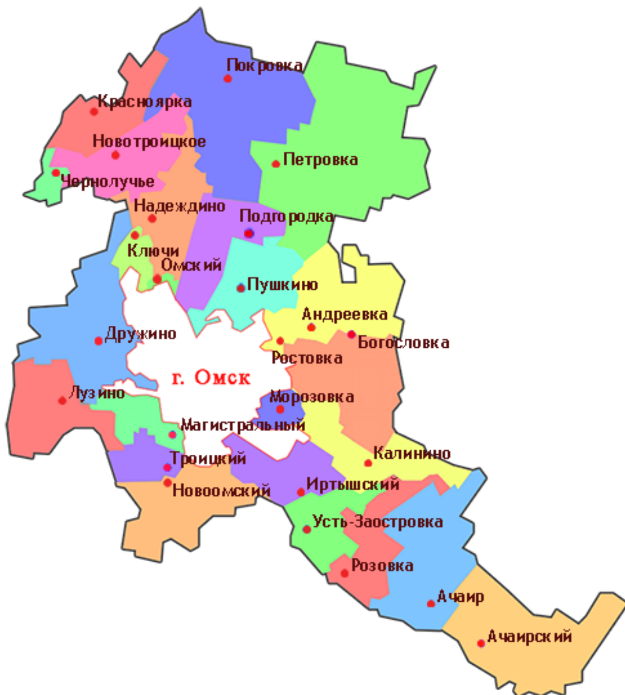
Рисунок 1 Схема расположения Новотроицкого СП в границах Омского района.